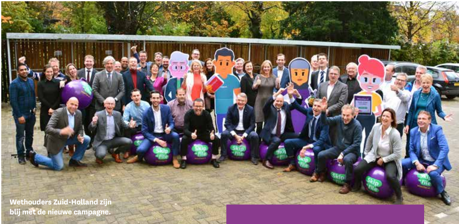
Wethouders Zuid-Holland zijn blij met de nieuwe campagne.