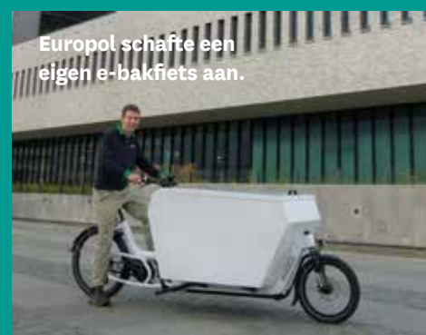
Europol schafte een eigen e-bakfiets aan.

je vracht' is vooral een interessant alternatief voor ritten in de stad, bijvoorbeeld voor huisartsen, advocatenkantoren, bloemisten of klusbedrijven. Een deelnemend bedrijf krijgt twee weken lang een (elektrische) vrachtfiets te leen. In 2019 maakte Van der Velde 't Veentje Verhuizingen, samen met Europol, gebruik van deze actie. Europol schafte naar aanleiding van deze actie een eigen e-bakfiets aan.